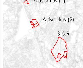
GRÁFICO DE FOLLAS

Delimitación PIA-VP S-5.R Delimitación PIA-VP S-5.R