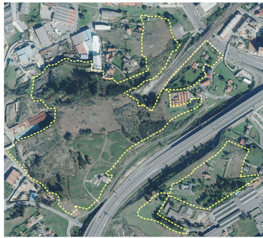
Sistemas xerais adscritos EL ADS 01 e EL ADS 02