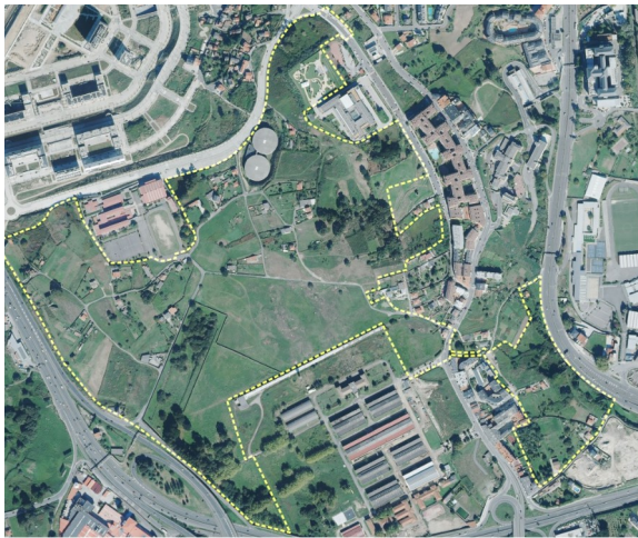
Sector SUD 4